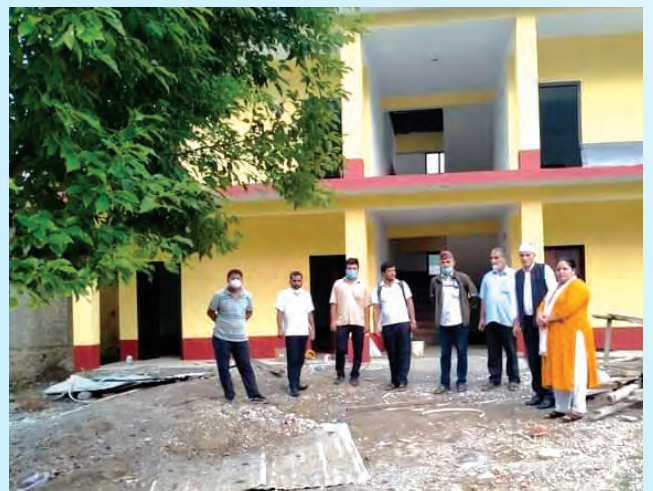
गुर्भाकोट क्याम्पस भवन अनुगमन ।