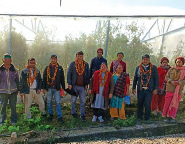
कृषि टनेल अनुगमन ।