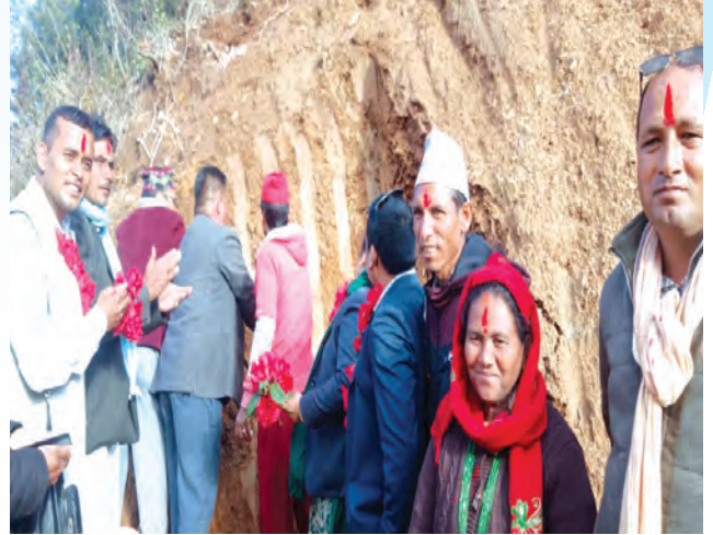
कोट-हिले सडक शिलान्यास ।