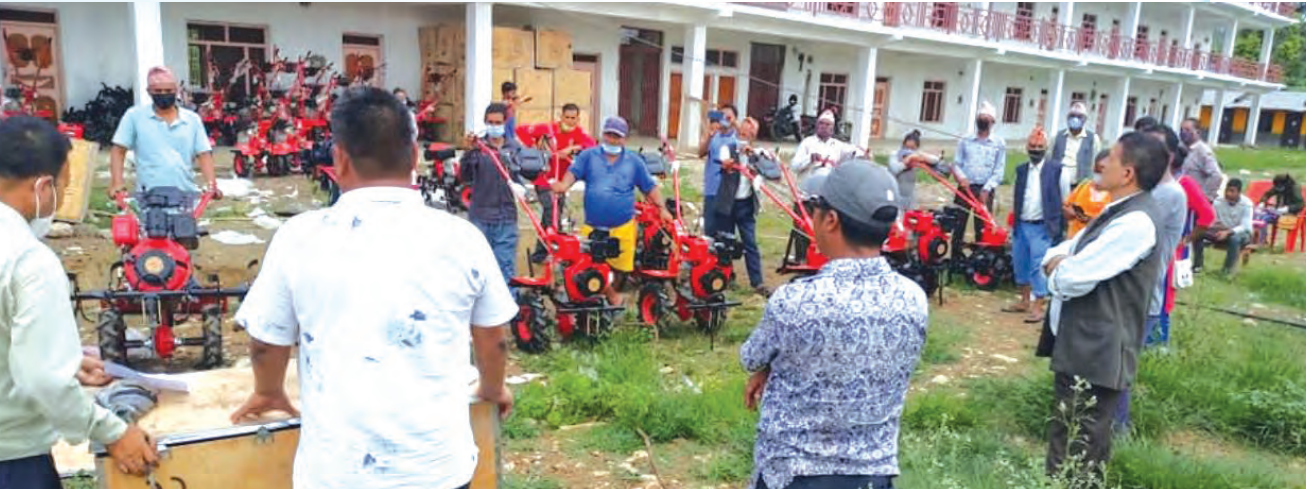
कृषकहरूलाई कृषि यन्त्र वितरण ।