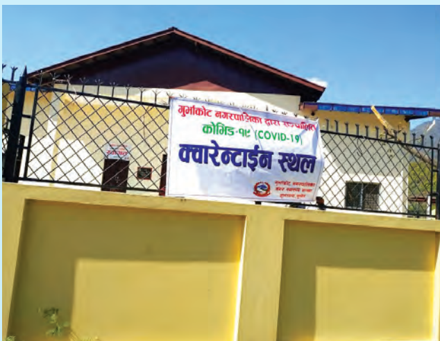
नगरपालिकाबाट स्थापित COVID 19 क्वारेन्टाइन