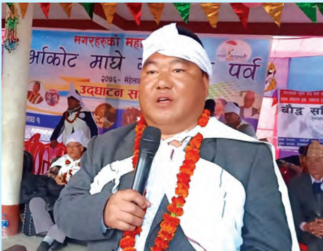
माघी पर्व मगर मेला कार्यक्रम ।