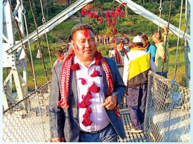
आमसोती भोलुङ्गे पुल उद्घाटन ।