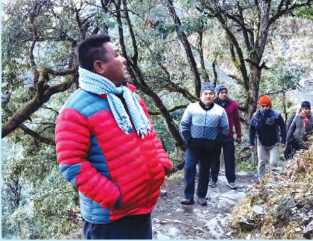
धारापानी सडक अनुगमन ।