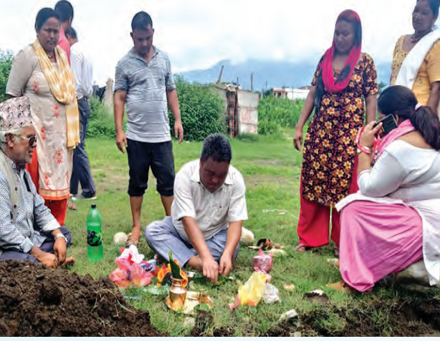
८ नं. वडा कार्यालय भवन उद्घाटन ।