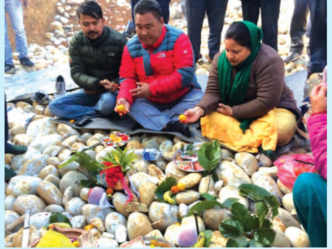
द नं. वडा कार्यालय भवन उद्घाटन ।