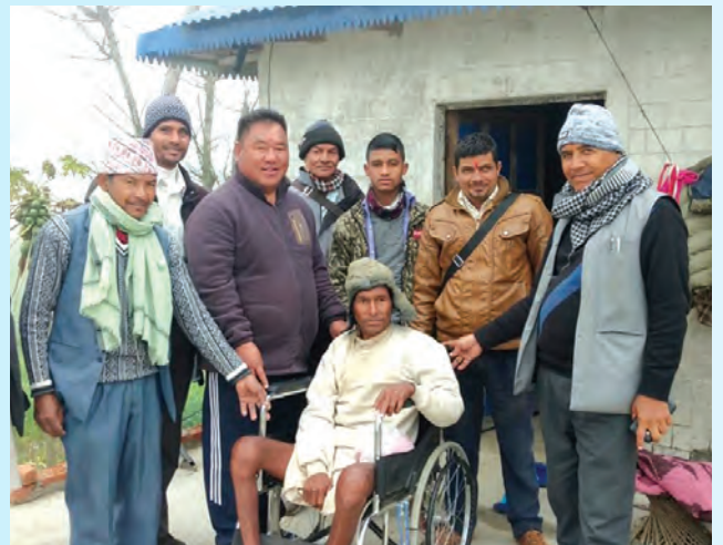
अपाङ्गतालाई ह्वल चियर सहयोग ।